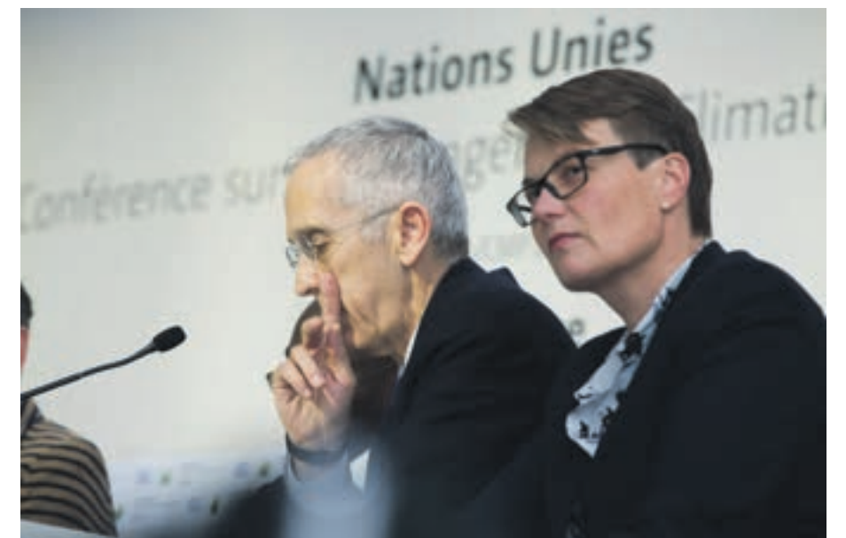
Klima- og miljøminister Tine Sundtoft (H) saman med USA sin sjefsforhandlar Todd Stern i Paris. På ny rangering over klimainnsats går USA forbi Noreg.

Verst i klassen. «Langtekkeleg» ser òg ut til å vere eit dekkande omgrep for den grøne omstillinga her heime. Det bodskapet blei klart under den siste veka av klimaforhandlingane, då den respekterte tankesmia Germanwatch slapp sin årlege rapport, The Climate Change Performance Index, kor dei målar klimainnsatsen til ulike land. Mens Danmark og Sverige i fleire år har vore blant dei høgast rangerte landa, er Noreg no nede på ein 36. plass – ned frå 24. plass i 2013 – og ein suveren