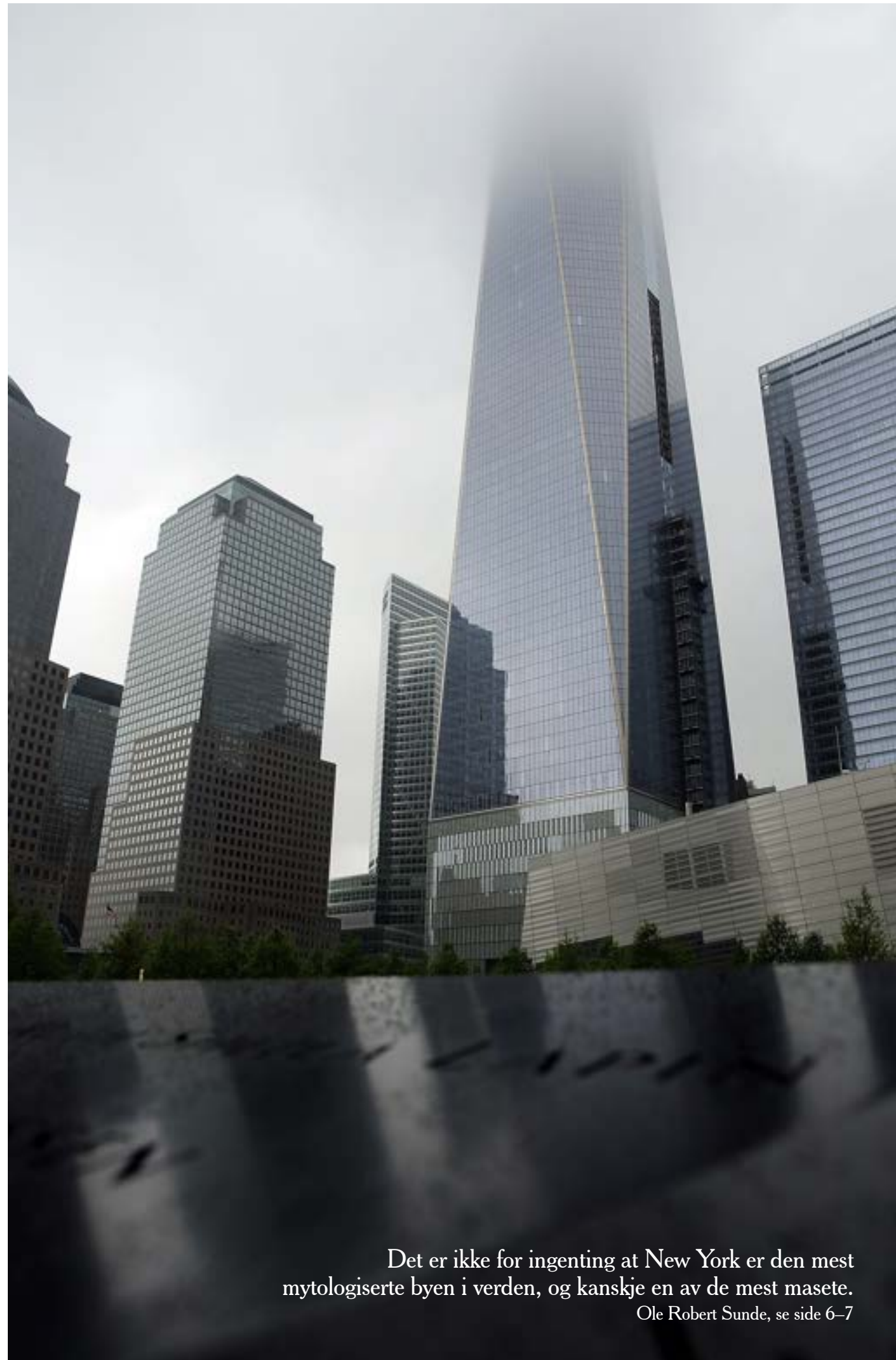
NEW YORK: The Freedom Tower

FLYKTNINGSPIONASJE ... fortsetter side 3