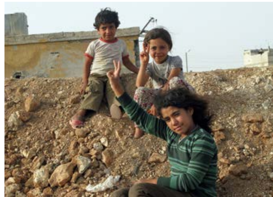
Akkurat no har desse tre og andre ungar i Kobanê bruk for at nokon vil «hjelpe dei der dei er»: rensing av drikkevann, skolebøker, et hus å bu i – istadenfor ruinaene etter det som var ein heim.