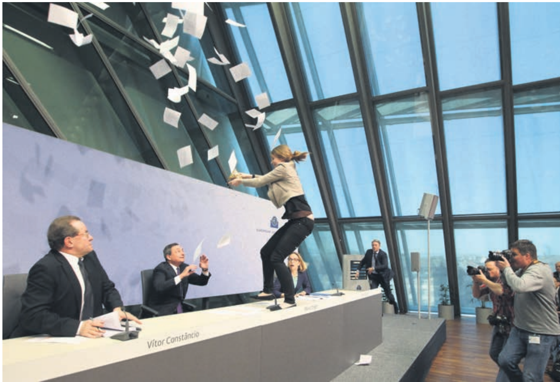
Den europeiske sentralbankens president angripes.

Vedlagt ukens dokumentar: 1 Building and 40 People Dancing