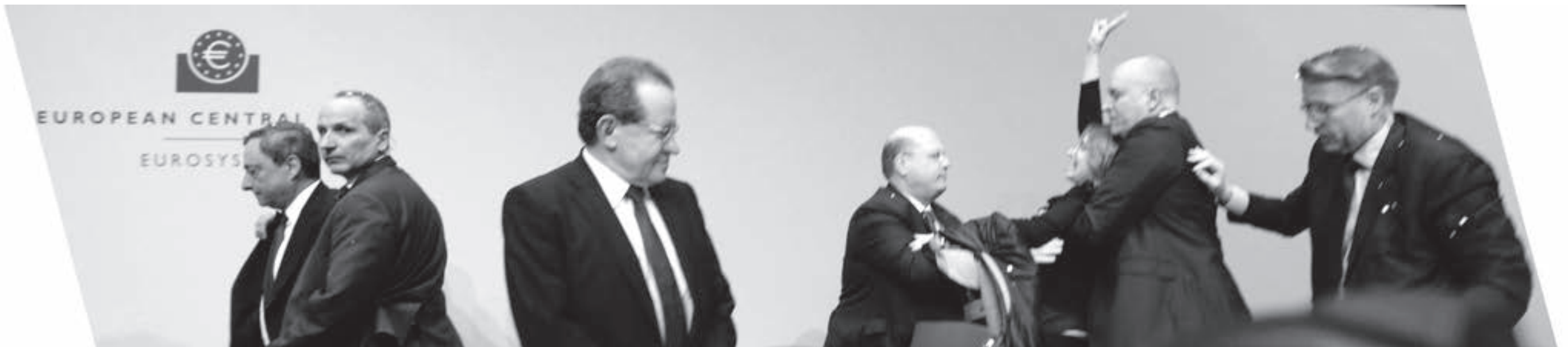
En kvinne hoppet opp på bordet og kaster papir og gullkonfekt for å avbryte en pressekonferanse ledet av presidenten for Den europeiske sentralbanken (ECB), Mario Draghi, i Frankfurt / Main. Hun ropte «Slutt på ECB-diktaturet!», men ble eskortert bort av sikkerhetsvakter.